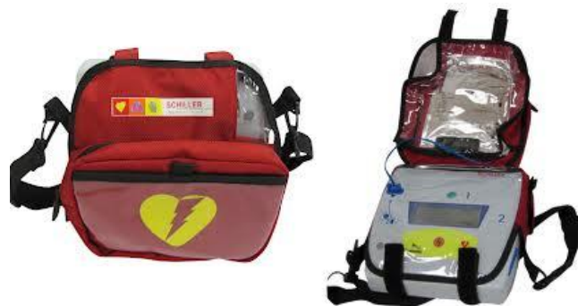
L'appareil sorti du coffret.

Ce défibrillateur est très simple d'usage, une fois aux côtés de la personne, il suffit d'ouvrir la housse et de suivre les indications de l'appareil.