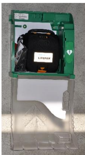
Le coffre ouvert, l'appareil est disponible.

Pour ouvrir le coffre de protection du défibrillateur, il suffit de tirer vers vous en tenant le capot de chaque côté. L'appareil est prêt à servir.