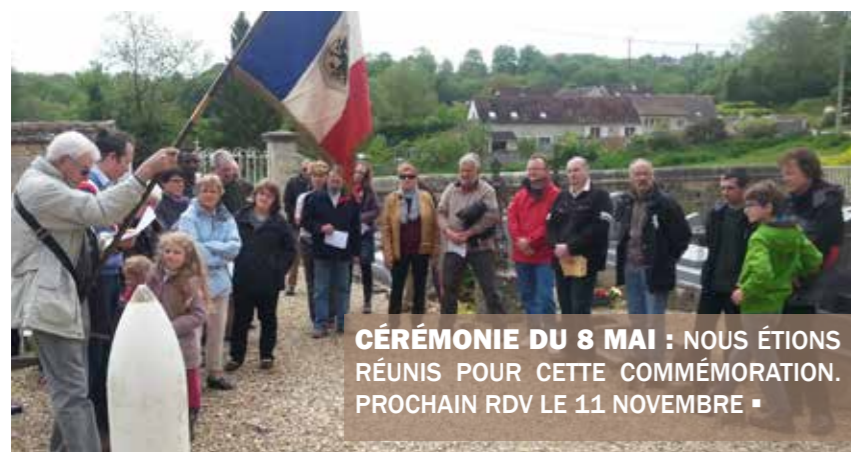
CÉRÉMONIE DU 8 MAI : NOUS ÉTIONS RÉUNIS POUR CETTE COMMÉMORATION. PROCHAIN RDV LE 11 NOVEMBRE ■

L'inauguration aurait lieu le 20 septembre à 15h30