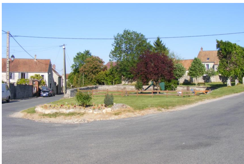
L'entrée du village vu de la route de Boubiers