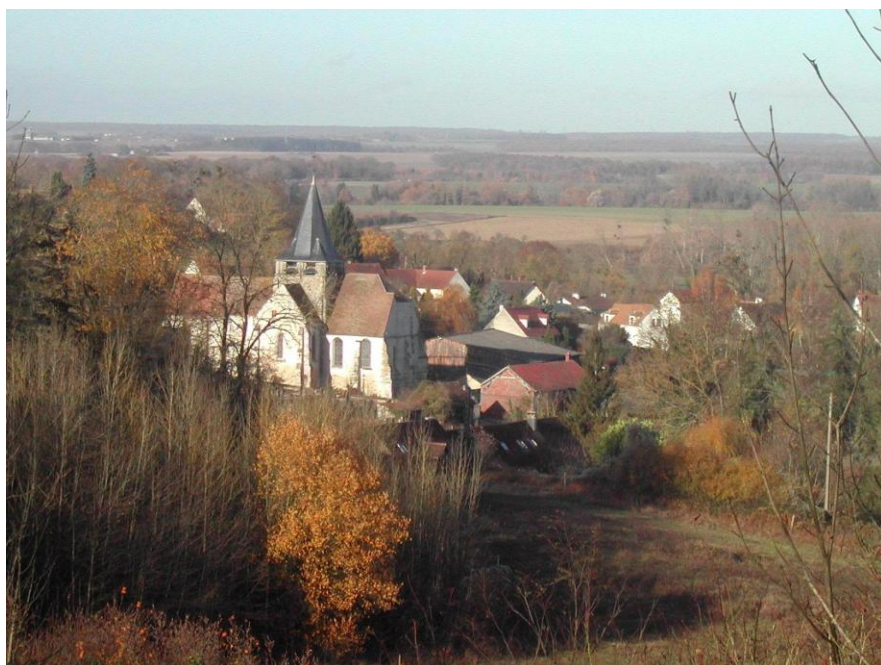
L'Eglise vu de la route des Groux (photo représentative de Liancourt Saint-Pierre)