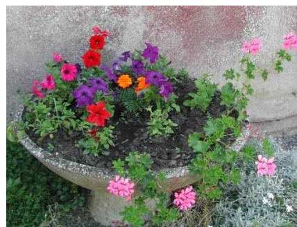
La commission Fleurs