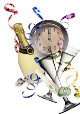
Le Conseil Municipal