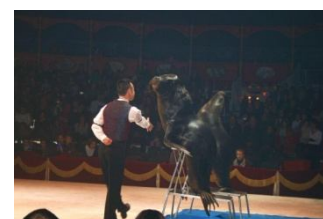
Sortie à Beauvais