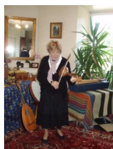
- Rebec -