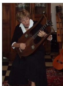
- Lyre Guitare - (fin 16ième)